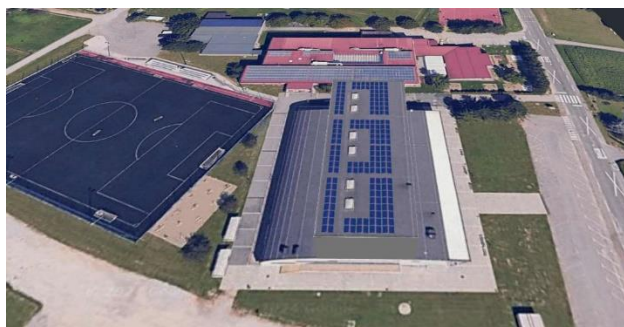
Slika: Obravnavani objekt Športna dvorana Duplek

Opravljen je bil vizualni ogled objekta in pregled razpoložljive projektne dokumentacije. Na obstoječo konstrukcijo se bo namestila fotonapetostna elektrarna, za katero se je upoštevala dodatna obtežba zaradi vgrajene podkonstrukcije in fotonapetostnih modulov v velikosti 15 kg/m 2 .